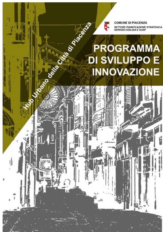
Identificazione delle modalità di governance unitaria