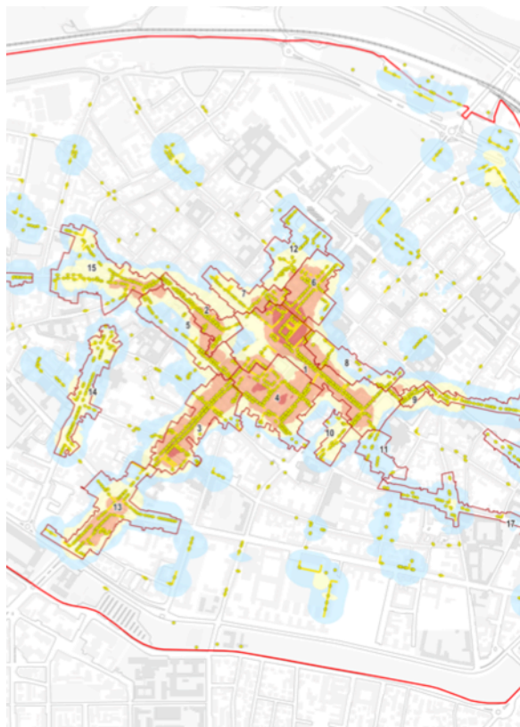
Individuazione, perimetrazione e dimensionamento dell'area