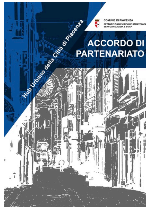
Accordo di partenariato